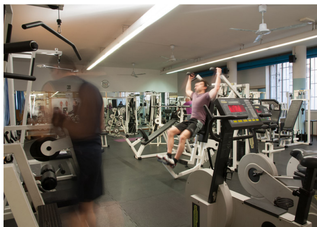
Palestra per la Rieducazione Neuromotoria Complessa e Meccanoterapia.