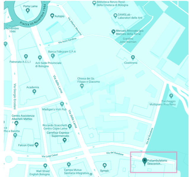
Via del Rondone, 1, 40122 Bologna BO

In via Lame, a circa 50 metri dal Poliambulatorio, ci sono le fermate della linea n° 86, 18 e la Navetta B. Dalla Stazione Centrale prendere la linea n° 33 e scendere a Porta Lame (Piazza VII Novembre 1944).